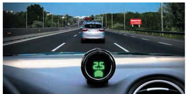
Biggest Deal in Israeli Hi-Tech History: Intel Buys Mobileye for $15 Billion The Jewish Press | JNi.Media |

12. Największa jak dotąd transakcja w historii izraelskiego hi-techu. Intel za 15 mld USD kupuje izraelską firmę MOBILEYE (główna siedziba w Jerozolimie). Firma specjalizuje się w dziedzinie zaawansowanych systemów wspomaganie kierowcy (ADAS) – ostrzegających, zapobiegających i łagodzących skutki kolizji. Centrum działalności Mobileye pozostanie w Izraelu.