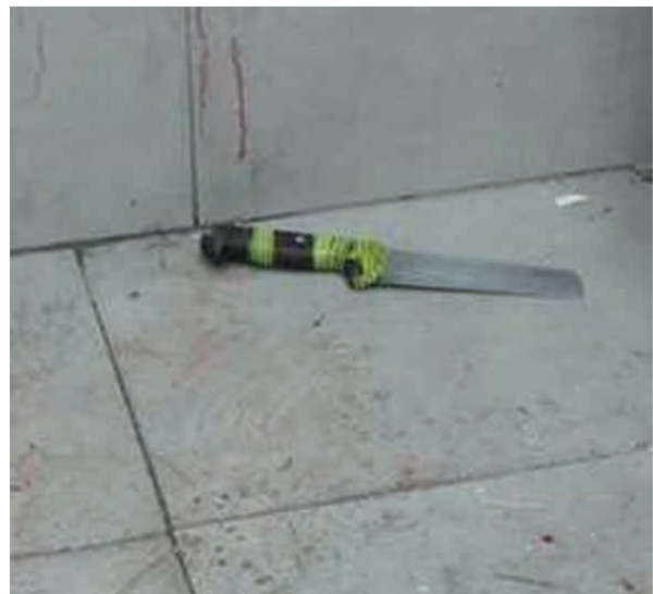
(Na górnym zdjęciu widać miejsce dokonania ataku)

8. Dzisiaj, ok. 4.00 nad ranem, przy bramie Wschodniej w Jerozolimie miał miejsce atak terrorystyczny na dwóch żołnierzy. Żołnierze zostali znieacka zaatakowani nożem przez 25-letniego Palestyńczyka. Oboje w stanie średnim znajdują się w szpitalu. Terrorysta zginął.