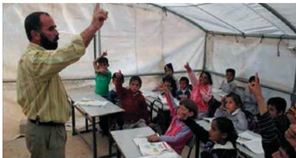
Palestinian children at UK taxpayer-funded school pretend to execute Israeli soldier

10. Edukacja. Dochodzenie ujawniło, że w wielu palestyńskich szkołach sponsorowanych przez rząd brytyjski i nazywanych od nazwisk znanych terrorystów, prowadzi się z dziećmi zajęcia z tego, jak zabijać Żydów!