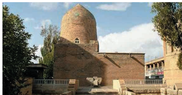
2,500 Years Later, Tombs of Esther and Mordechai Still Standing in Iran

2. W Izraelu obchodzone jest biblijne święto Purim, będące dowodem Bożej wierności i zwycięstwa w obliczu zbliżającej się zagłady.