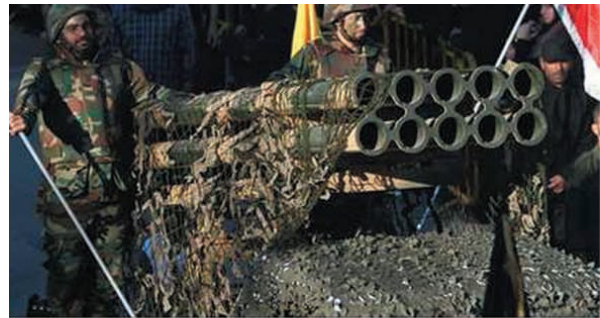
Iran reportedly built weapons factories in Lebanon for Hezbollah

5. Liban. Hezbollah opublikował w mediach filmik, pokazujący ich potencjalne cele (elektronie) w Izraelu. Izrael natychmiast ostrzegł ich, że kolejny atak, będzie ich ostatnim.