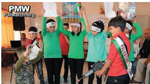
Britain: Huge Amounts of Foreign Aid Pumped into Terror Schools

11. Izraelski premier Benjamin Netanjahu przyjął zaproszenie do udziału w lipcowym spotkaniu Grupy Wyszehradzkiej na Węgrzech.