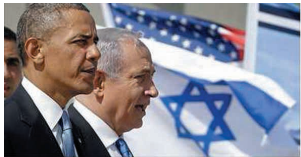
U.S. $38B military aid package to Israel sends a message Israel may now be able to buy expensive new systems it couldn't afford in the past.

13. Yacov Nagel, zastępca doradcy do spraw bezpieczeństwa narodowego, przybył dzisiaj do Waszyngtonu w celu podpisania memorandum bezpieczeństwa, które określa pomoc USA dla Izraela. Zgodnie z tym porozumieniem Izrael otrzyma pomoc wojskową w wysokości 38 miliardów dolarów w ciągu 10 lat, włącznie z możliwością użycia części tych pieniędzy na izraelski przemysł wojskowy. Jest to największa jak do tej pory pomoc uzyskana od USA.