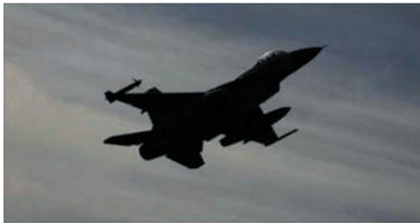
Israel strikes Syrian targets after mortar hits Golan Heights

12. Po południu z bazy wojskowej Palmachim wystrzelono rakietę, która wyniosła na orbitę okołoziemską satelitę rozpoznawczego Ofek 11 . Satelita będzie prowadził zadania wywiadowcze na obszarze całego Bliskiego Wschodu. Poprzedniego satelitę o nazwie Ofek 10 wystrzelono 2 lata temu.