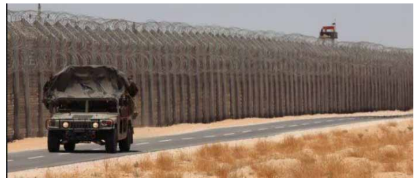
Izraelski patrol na granicy Egipt-Izrael)

ściu miesięcy Egipcjanie przeszli proces dojrzewania. Zrozumieli, że zmieniły się zasady walki: nie ma już wojsk walczących między sobą, lecz armia stoi w obliczu organizacji terrorystycznej. My w Siłach Obronnych Izraela poprawiliśmy naszą skuteczność. Rozumiemy, że zagrożenia się zmieniły, i dokonaliśmy zmian umożliwiających nam odpowiadanie na ciosy, zanim jeszcze na nas spadną. Znacznie poprawiliśmy nasze zdolności obronne wzdłuż całej granicy mającej 220 km”.