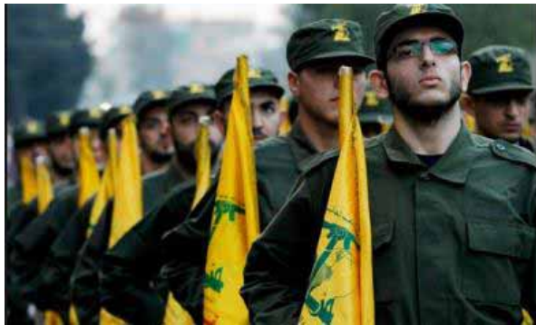
Wojska terrorystów z Hezbollahu

Módlmy się by te rakiety przygotowane na Izrael, nie zostały użyte... „Żadna broń ukuta przeciwko tobie nic nie wskóra...” Iz.54,17.