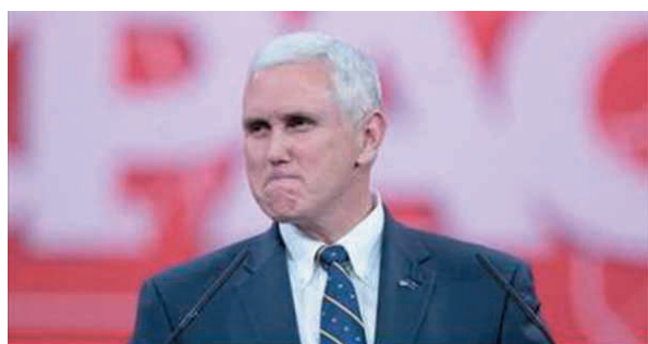
Mike Pence To Place His Hand On 2 Chronicles 7:14 When He Takes The Oath

11. USA. Mike Pence, jeden z chrześcijańskich doradców nowego prezydenta, przygotował do odczytu na uroczystości werset dot. odnowy kraju: „I ukorzy się mój lud, który jest nazwany moim imieniem, i będą się modlić, i szukać mojego oblicza, i odwrócą się od swoich złych dróg, to Ja wysłucham z niebios, i odpuszczę ich grzechy i ich ziemię uzdrowię”. II Kron. 7,14