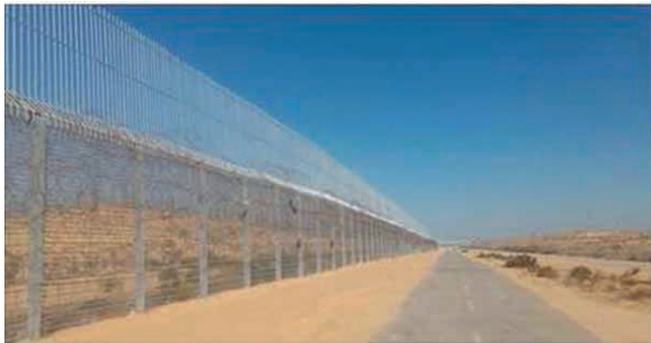
Israel completes heightened Egypt border fence

6. Izrael-Egipt. Izrael podwyższa płot graniczny z Egiptem z 5 do 8 metrów wysokości. Jest to próba lepszego zabezpieczenia kraju od strony Egiptu, gdzie pojawiają się oddziały ISIS walczące z egipską policją.