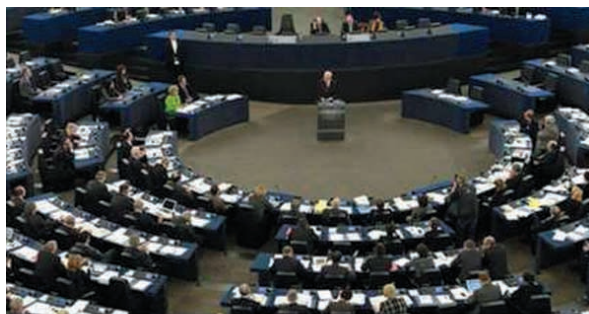
'True friend and lover of Israel' elected EU president.