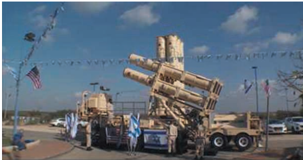
Israel enters 'new era' of missile defense with Arrow-3

5. Siły Obronne Izraela (IDF), otrzymały nowy system rakiet przechwytyjących Arrow 3. System jest przeznaczony do przechwytywania wrogich rakiet balistycznych. Początki systemu sięgają 1988 r. Pod koniec 2015 r. system Arrow 3 przeszedł pomyślne testy w Stanach Zjednoczonych. Został on opracowany przez Izrael Aerospace Industries we współpracy z Boeingiem.