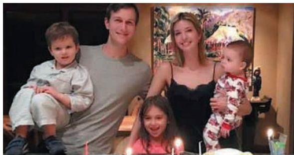
Report: Ivanka Trump gets pass to travel on Shabbat for inauguration

12. Ivanka Trump, córka Donalda Trumpa, oraz jej mąż, którzy przybędą na jutrzejszą uroczystość przejścia prezydentury, a którzy stanowią ortodoksyjną żydowską rodzinę, otrzymali rabiniczne błogosławieństwo na złamanie zasad szabatu związanych z podróżowaniem w tym czasie, ponieważ jest to związane ze względami bezpieczeństwa. *Jest to ciekawa sytuacja praktyczna, która pokazuje, że zasady szabatu nie są takie sztywne, jak się to czasem wydaje lub mówi. Sprawy życia i bezpieczeństwa są nadrzędne nad tym świętym Bożym dniem świętowania Stworzenia.