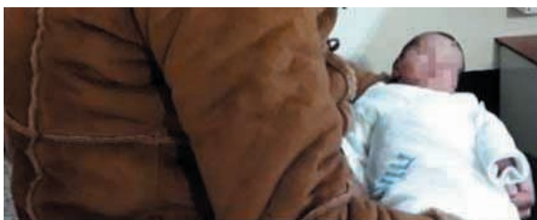
Syrian woman gives birth to healthy girl in Israeli hospital, names her Sarah

7. Syria-Izrael. 29-letnia kobieta w zagrożonej ciąży została przewieziona przez granicę