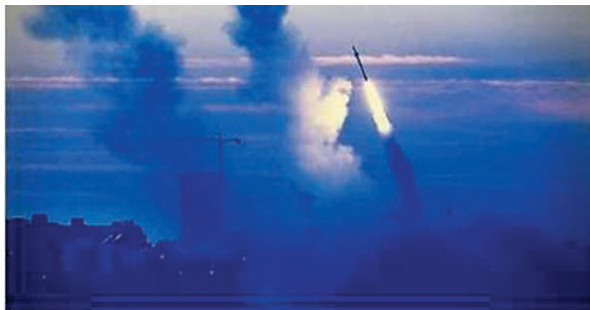
BREAKING NEWS: Hamas Fires Rocket at Sderot, Shattering Quietest Summer in Years

9. Po godzinie 14.00 w regionie Gazy pojawiły się trzy alarmy raketowe. Jedna z rakiet trafiła w miasteczko Sderot, uderzając w ziemię między domami mieszkalnymi. Dzięki Bogu nie wybuchła i nikt nie został ranny. Saperzy zajęli się jej rozbrojeniem. W odróżnieniu od dotychczasowych działań, kiedy to wojsko odpowiadało na ataki czekając kilka godzin najczęściej do wieczora, tym razem IDF wysłał samoloty do ataku celów Hamasu natychmiast po ataku. Do tej pory miały miejsce już kilkakrotne ataki lotnictwa na cele Hamasu w Gazie. Mimo że odpowiedzialność za atak na Sderot wzięła na siebie komórka ISIS, wg. informacji izraelskich ataku dokonał Hamas.