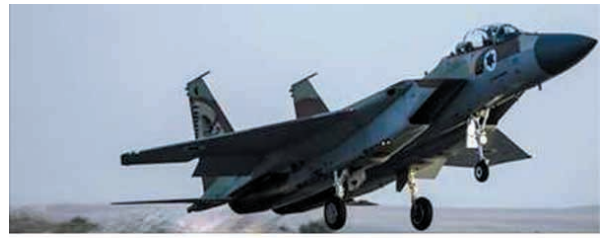
Gaza Rocket Explodes in Southern Israel; IAF Strikes Gaza Targets