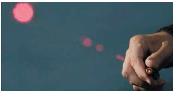
Une nouvelle arme dans l'arsenal terroriste arabe palestinien: le laser

5. Palestyńczycy coraz częściej używają nowej broni – lasera kieszonkowego. Laser taki o coraz większej mocy można kupić w sklepach. Skierowany bezpośrednio na siatkówkę oka może spowodować czasową ślepotę i np. wypadek kierowcy pojazdu. Palestyńczycy próbują używać go głównie na drodze nr 443 koło Modin biegnącej przez tereny Samarii i oślepiają jadących drogą kierowców. Zgłaszane były już też przypadki próby oślepienia pilotów samolotów podchodzących nisko do lądowania. *W przypadku zauważenia takiego światełka, wystarczy nie kierować na nie bezpośrednio wzroku i wówczas nie jest groźne.