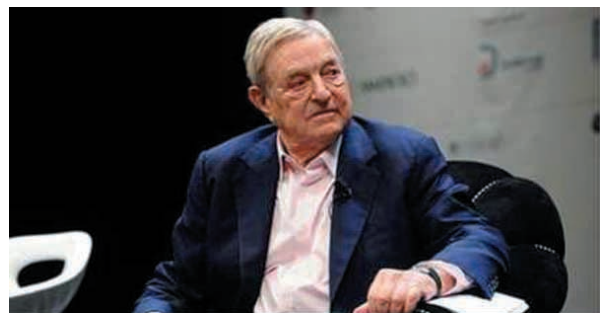
DC Leaks Publishes George Soros' Files Showing Millions Contributed to Anti-Israel Causes

10. W każdym kraju bez wyjątku są ludzie działający na jego szkodę. Podobną postacią w Izraelu jest George Soros, który u nas, głównie przez zagorzałych antysemitów, często podawany jest jako przykład Żyda działającego na szkodę świata. Nie jest to postać, którą można by oceniać mieszkańców Izraela, a wręcz wyjątek, który jest potępiany w Izraelu. Wyjawiono właśnie kolejne informacje dot. jego działalności antyizraelskiej.