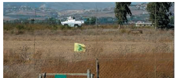
Israel suspects Hezbollah behind explosives found near northern border - Israel News

8. Podano do wiadomości, że ładunki wybuchowe znalezione w torbie przez rolnika na jego polu koło Metulli 3 tygodnie temu, zostały przemycone z Libanu. Nie jest jasne, do czego były przeznaczone i kto miał je odebrać. Przemysł narkotyków w tym okręgu jest na porządku dziennym, natomiast materiały wybuchowe nie były przemycane od lat.