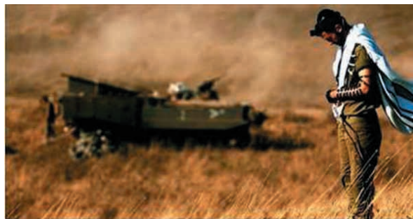
IDF Preparing to Welcome Elite Ultra-Orthodox Paratrooper Platoon - Breaking Israel News | Israel

3. IDF przygotowują się do powitania tworzonego właśnie elitarnego plutonu spadochronowego – jednostki składającej się z samych ultra-ortodoksyjnych Żydów.