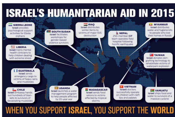
Foto: Pomoc humanitarna Izraela na świecie w 2015 roku

12. W ramach bojkotu Izraela 71 brytyjskich lekarzy zgłosiło wniosek o wykluczenie Izraela z Międzynarodowego Stowarzyszenia Medycznego! Izrael zawsze jako pierwszy wysyła ekipy ratunkowe po największych kataklizmach w każdy rejon świata!