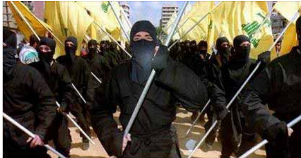
BREAKING: Kerry Admits 'Some' Iran Deal Money Will End Up In the Hands of Terrorists

łym świecie i budował fabryki broni poza swoim krajem (np. w Sudanie). Ta właśnie broń i rakiety trafiły do Strefy Gazy, skąd były wyrzucane na Izrael. Obecnie uzbraja Hezbollah w Iranie.