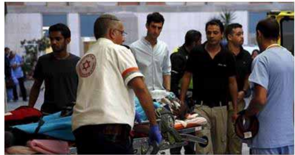
British doctors seek to expel Israel from World Medical Association