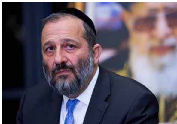
Foto: Minister spraw wewnętrznych, Arie Deri

8. Minister spraw wewnętrznych, Arie Deri, anulował dzisiaj prawo rezydencji czterem terrorystom, którzy zamieszani byli w zamachy kamieniami i morderstwo czterech Izraelczyków.