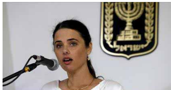
'Time to help them': Israeli justice minister calls for independent Kurdish state

• W Biblii znajduje się ciekawe proroctwo z czasów ostatecznych związane z unią między Izraelem, Egiptem i Asyrią (tereny państwa kurdyjskiego mogłyby obejmować dawne imperium asyryjskie). Czyżby utworzenie takiego państwa mogło być znakiem wypełnienia się kolejnego proroctwa z czasów ostatecznych? (Iz. 19,22-25)