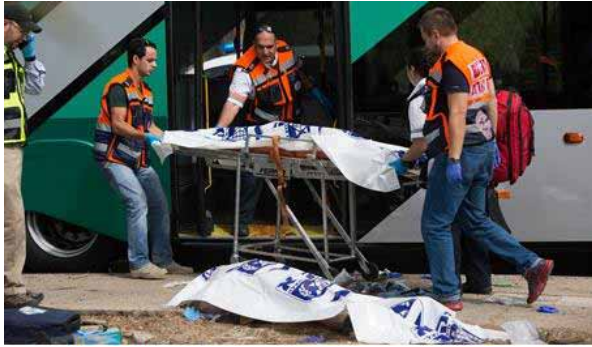
Foto: Wspomniane zabójstwo czterech Izraelczyków

8. Zarząd miasta Jerozolimy zawiadomił właścicieli prywatnych supermarketów, które były otwarte również w szabat, że od kwietnia mają zakaz otwierania w tym dniu sklepów.