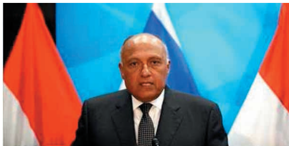
Egyptian FM sparks uproar by saying Israel not guilty of 'terrorism'

Natychmiast przyszła odpowiedź rzecznika Hamasu, Husama Badrana: „Kto nie dostrzeżga terroru w okupacji syjonistycznej, ten jest ślepy”. *Pod silnymi naciskami Szukri zaczął się później wycofywać ze swoich słów. W krajach muzułmańskich przyznanie racji Izraelowi wciąż jest aktem odwagi.