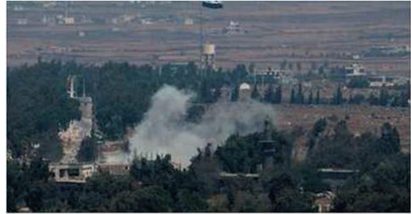
Mortar fire from Syria lands in Golan Heights

5. Wzgórza Golan. Jak podają w tej chwili IDF, kilka minut temu na północnym Golanie, na terenach Izraela, spadł pocisk moździerzowy wystrzelony z Syrii. Nie ma rannych. W odpowiedzi IDF zaatakowały wyrzutnie artylerii wojsk syryjskich. Rzecznik IDF podał, że IDF uważają rząd syryjski za odpowiedzialny za to ostrzelanie.