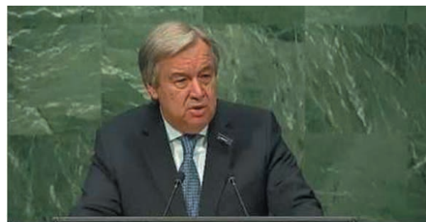
Palestinians: UN Chief Must Apologize for Admitting Existence of Jewish Temple in Jerusalem

7. UE – Autonomia Palestyńska . Wysoki urzędnik rządu Autonomii Palestyńskiej oburzony ogłosił, że nowo wybrany szef ONZ musi przeprosić za wzmiankę o istnieniu w przeszłości żydowskiej świątyni w Jerozolimie.