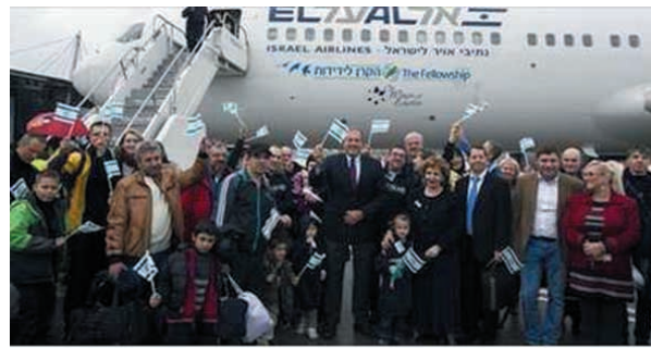
Jewish immigrants flee Ukrainian civil war

6. Do Izraela przyleciała grupa 211 nowych żydowskich imigrantów z Ukrainy. Ich przylot został zorganizowany przez International Fellowship of Christians and Jews (IFCJ). W grupie tej znajduje się 37 dzieci, które za dwa dni rozpoczną naukę w izraelskich szkołach. Większość imigrantów pochodzi z Dniepropietrowska, do którego zbiega większość uciekinierów z objętych walkami terenów na wschodniej Ukrainie.