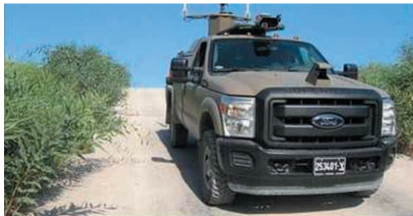
Robot patrol: Israeli Army to deploy autonomous vehicles on Gaza border | Fox News

4. Gaza. Wzdłuż granicy z Gazą IDF testują nowoczesne bezzałogowe samochody patrolujące granicę. Tego typu urządzenia mają za zadanie uchronić przed zagrożeniem życia żołnierzy strzegących granic.