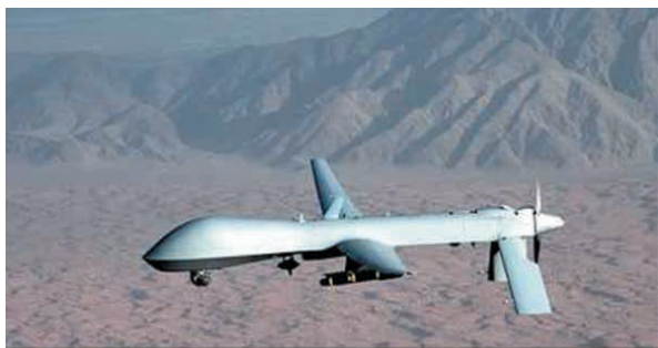
Russia Confesses to Flying Mysterious Drone into Israel

6. Siły Obronne Izraela poinformowały, że dron, który trzy tygodnie temu naruszył przestrzeń powietrzną Izraela nad Wzgórzami Golan, nie był ani syryjski ani nie należał do Hezbollahu, lecz był własnością rosyjskiej armii. W połowie lipca niezidentyfikowany dron wleciał około 4 km w głąb izraelskiej przestrzeni powietrznej, po czym zawrócił i odleciał do Syrii. W jego kierunku wystrzelono dwie rakiety Patriot. Również izraelski myśliwiec podjął bezskuteczną próbę jego zestrzelenia. Wkrótce potem Hezbollah wziął na siebie odpowiedzialność za ten incydent. Jednak w rozmowie telefonicznej premiera Benjamina Netanjahu z prezydentem Rosji, Władimirem Putinem, ten przyznał się, że w rzeczywistości był to rosyjski bezzałogowy dron. Dodał, że do incydentu doszło w wyniku ludzkiego błędu.