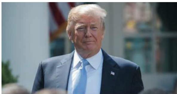
Donald Trump ogłosił, że wycofa USA z porozumienia nuklearnego z Iranem

W dniu dzisiejszym prezydent Trump ogłosił wycofanie się z tzw. Układu Atomowego z Iranem, który w praktyce umożliwił Iranowi prace nad bronią atomową, oraz nałożenie wkrótce na Iran sankcji w związku z tymi pracami.