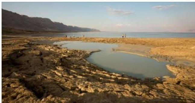
Israel, Jordan unveil $800M joint plan for 'Red-Dead' canal

*We wrześniu b.r. wzdłuż drogi do Eilat ułożono już kilometry rur. Z drugiej jednak strony dodatkowe zasoby wody z Morza Czerwonego mogą spowodować poważną zmianę zasolenia Morza Martwego, a co za tym idzie i wypełnienie się kolejnego z proroctw, które mówi o tym, że rybacy będą łowić ryby w tym morzu, a sieci będą suszyć w En Gedi (Księga Ezechiela .47,10).