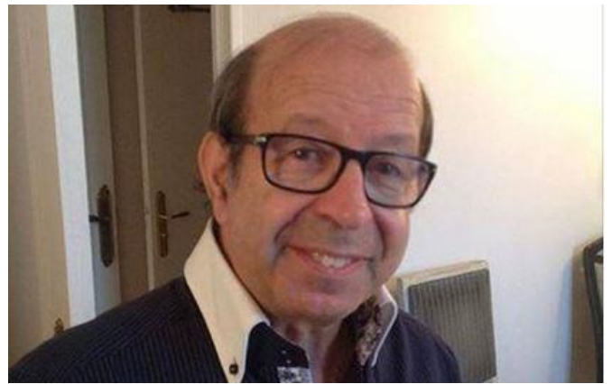
(Foto: Zaatakowany żydowski nauczyciel oraz zamordowany w Paryżu polityk)

Wdzięczność Izraela. W Riszon le Tzion w Izraelu postawiono pomnik dla Filipin, które otworzyły drzwi dla uciekających przed groźbą Holokaustu Żydów. Ratunek znalazło tam wówczas 1200 Żydów z Europy.