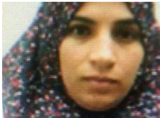
(Foto: Blokadę rozstawiono w poszukiwaniu groźnej terrorystki oraz jej zdjęcie)

Kolejny atak. Rano, podczas kontroli samochodu, terrorysta próbował dźgnąć nożem żołnierzy koło osiedla Hermes w Samarii. Został „zlikwidowany”. Wśród żołnierzy nie ma rannych.