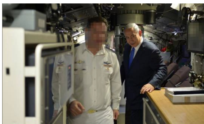
(Foto: Premier zwiedzający okręt podwodny INS Rahav w porcie wojennym w Hajfie)

Terrorysta, któremu udzielana jest pierwsza pomoc zaraz po tym, jak zaatakował nożem izraelskich żołnierzy (na zdjęciu poniżej). Czy jeszcze gdzieś na Bliskim Wschodzie tak się dzieje? Zgodnie z ostatnimi rozporządzeniami dotyczącymi ataków terrorystów w Izraelu lekarz zobowiązany jest do udzielenia pomocy rannym wg ich stanu. Pierwsi otrzymują pomoc ranni w stanie krytycznym, nawet jeśli są to terroryści. Lekarz nie ma prawa ustalać, kto jest ofiarą, a kto napastnikiem. Od tego jest sąd. Może zdarzyć się sytuacja, że poprzez ratowanie terrorysty, umrze ofiara. Lekarz nie może tracić czasu na rozpatrywanie, kto jest kim. Nie zawsze jest to jasne, zwłaszcza gdy liczba ofiar jest duża. Sprawa wywołała burzę w Izraelu.