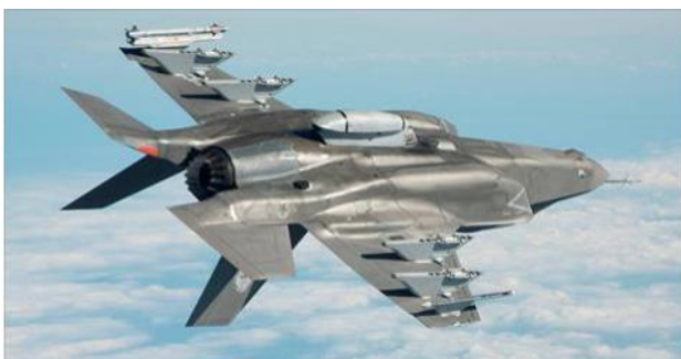
WATCH: Israel Gets its First F-35 Stealth Fighter

Może on prowadzić działania operacyjne daleko poza granicami własnego kraju, pozostając przez cały czas w ukryciu. Wszystkie systemy informatyczne samolotów są produkowane w Izraelu. Stany Zjednoczone zrobiły szczególny wyjątek co do tego elementu, pozwalając Siłom Powietrznym Izraela używać własnych systemów walki elektronicznej. *Tego typu samoloty mają szczególne znaczenie dla obrony i bezpieczeństwa Izraela.