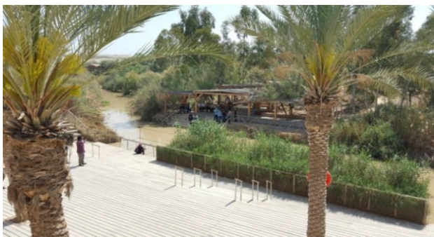
(Foto: Jordan blisko Jerycha, prawdopodobne miejsce przejścia Izraelitów z Jozuem do Kanaanu)

5. Izrael ogłosił nowe święto narodowe (w odróżnieniu od Świąt Biblijnych): „Jom ha-Aliya” – hebr. „Dzień Alji”. We wtorek wieczorem Kneset większością głosów ustanowił to święto jako uznanie wkładu imigracji i nowych Olim (hebr. imigrantów) w rozwój państwa. Na święto to wyznaczono hebrajską datę – 10 dzień miesiąca Nissan. Dzień ten przypada tuż przed Paschą i uważa się go za datę, kiedy Jehoszua (Jozue) przekroczył rzekę Jordan z Izraelitami. Była to pierwsza alija do Ziemi Izrael.