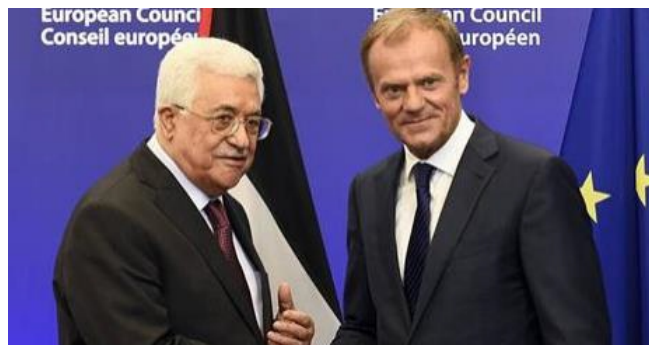
Palestinian Pres. Refuses to Meet Israel, EU Hopes for Israel-Palestinian Talks Fall Flat

6. Podczas odbywającej się w tym samym czasie wizyty w Brukseli prezydentów Izraela i Autonomii, M. Abbas odrzucił możliwość spotkania się z prezydentem Izraela.