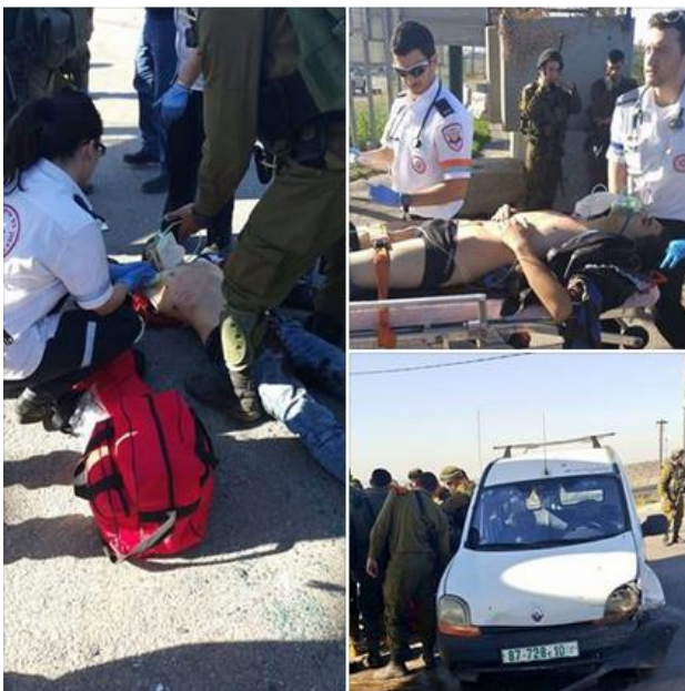
(Foto: Pierwsza pomoc udzielana rannemu terrorystcie, który chwilę wcześniej strzelał do żołnierzy na punkcie kontrolnym)

5. Atak na drodze 443. Po nieudanej próbie przejechania żołnierzy IDF na punkcie kontrolnym, terrorysta otworzył ogień. Nikt nie został ranny. Terrorysta znajduje się w stanie ciężkim.