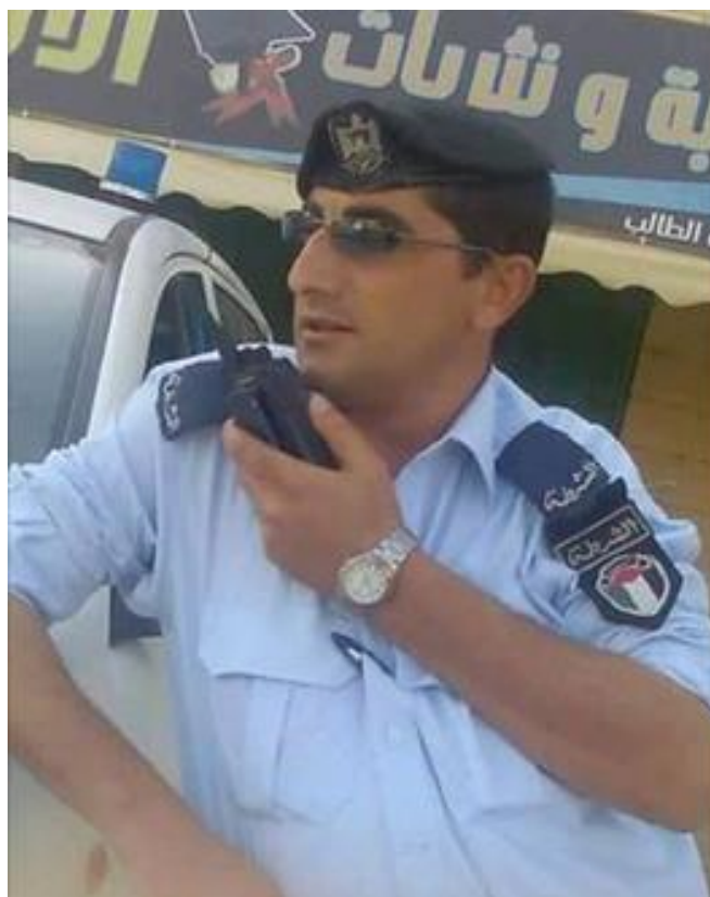
(Foto: Palestyński policjant, który dokonał zamachu terrorystycznego)