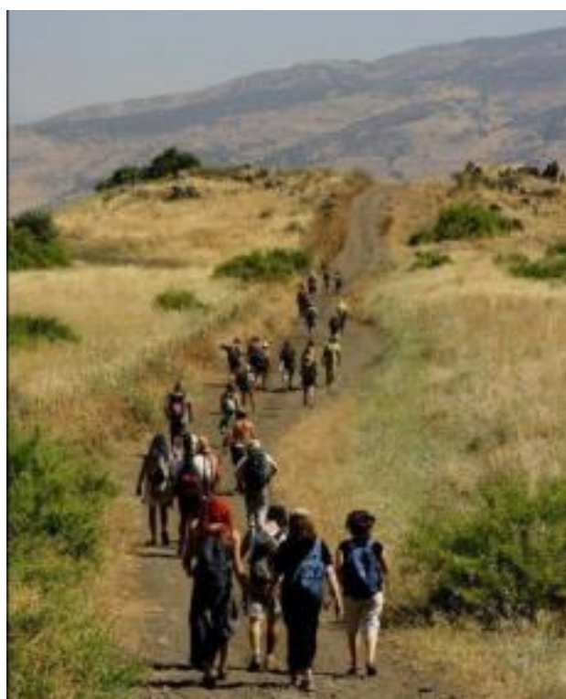
Galilea, szlaki turystyczne