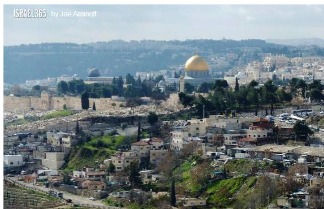
Jerozolima, Wzgórze Świątynne