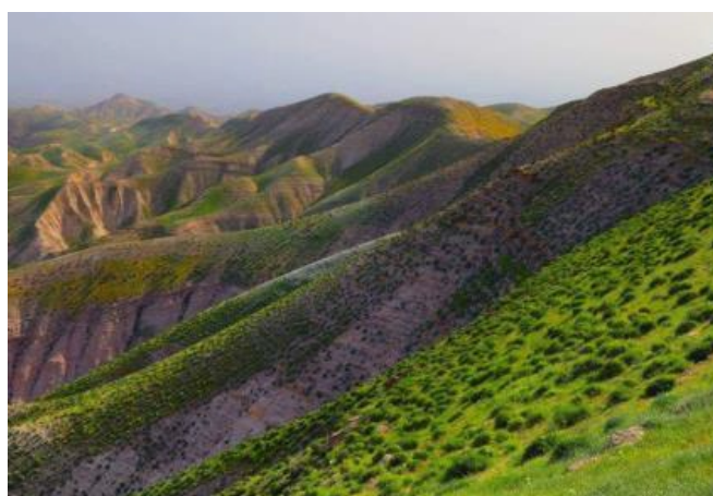
Pustynia Judzka na wiosnę