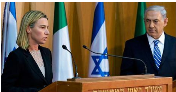
'EU doesn't recognize Israeli occupation of the Golan'

2. Fredericia Morgherini ogłosiła, że UE również opowiada się za oddaniem Syrii strategicznych Wzgórz Golan. (*Tak naprawdę nie wiadomo konkretnie, któremu z islamskich państw, które walczą o podział Izraela, mają być oddane te Wzgórz. Każda z opcji skończy się kolejnymi atakami na Izrael, tym razem z północy, do czego Izrael nie może dopuścić.)