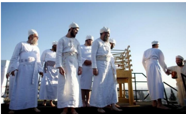
An Orthodox Jewish priest holds a container filled with blood from a freshly slaughtered sheep during a reenactment ceremony of the Passover sacrifice in Jerusalem, April 18, 2016.