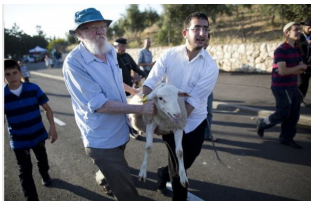
Orthodox Jews from the Temple Mount Institute carry a sheep to be sacrificed during the reenactment of the Passover sacrifice ceremony in Mount of Olives near Jerusalem, 18 April 2016.