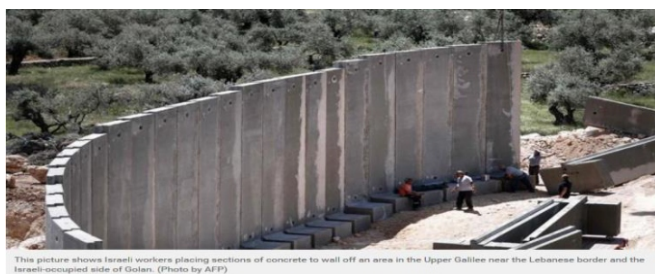
This picture shows Israeli workers placing sections of concrete to wall off an area in the Upper Galilee near the Lebanese border and the Israeli-occupied side of Golan.

Równocześnie Siły Obronne Izraela podejmują wysiłek wznoszenia nowych barier ochronnych na najbardziej niebezpiecznych odcinkach granicy z Libanem . Dotyczy to głównie miejsc, w których blisko granicy znajdują się izraelskie miejscowości. (Presstv)