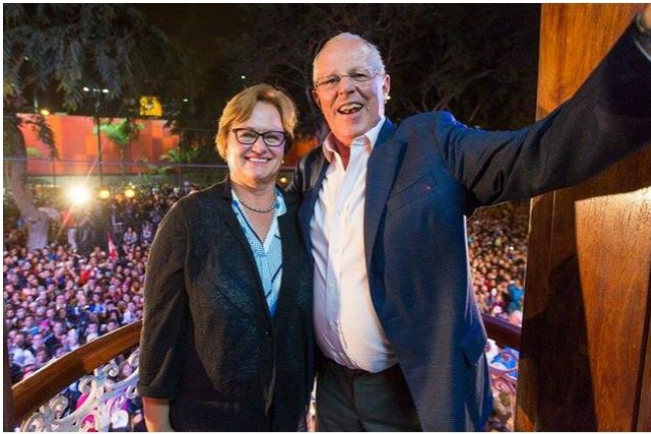
Pedro Pablo Kuczynski po wstępnych wynikach wyborów został prezydentem Peru. Czego może ten 77-latek nauczyć polskich polityków?

Błogosławieństwo dla Brazylii, ale również dla Peru, gdzie prezydentem został wnuk polskiego Żyda z Poznania.