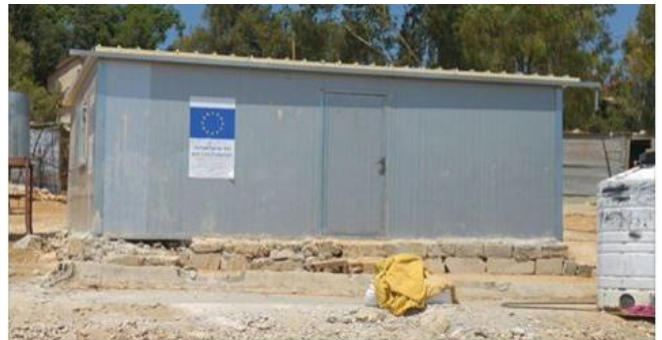
EU builds illegal Palestinian homes - next to Israeli town

chcąc utrwać i rozwijać palestyńską obecność na tym rdzennie żydowskim terenie zwanym w Biblii „Judeą”.