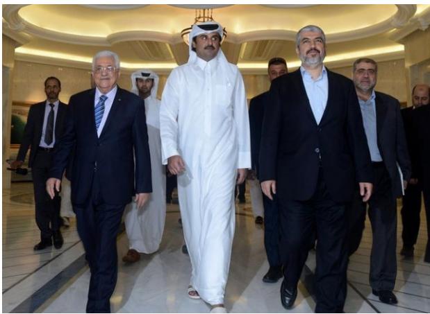
(Foto: Emir Kataru, najbogatszego obecnie kraju świata, w otoczeniu Palestyńczyków z Hamasu i Autonomii)

1. „Palestyńskie” źródła donoszą, że Emir Kataru postanowił sfinansować miesięczne opłaty za lipiec pracownikom Hamasu (terrorystom) w Gazie, którzy nie dostają ich regularnie od roku 2007.