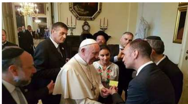
Pope Francis becomes newest Krakow JCC member