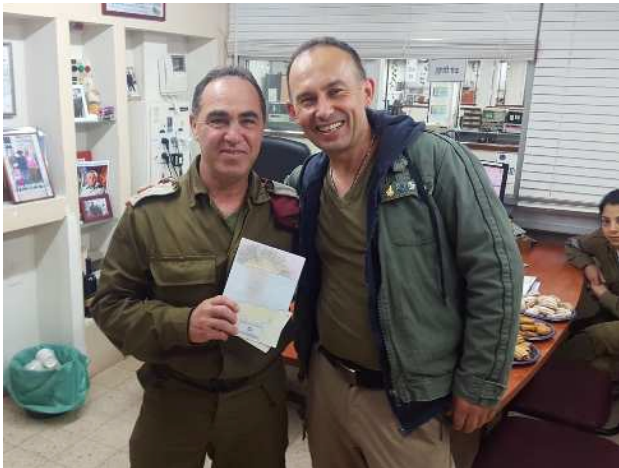
(Pożegnanie z moim dowódcą (na wolontariacie wojskowym), który otrzymał jedną z kartek dla żołnierzy IDF)