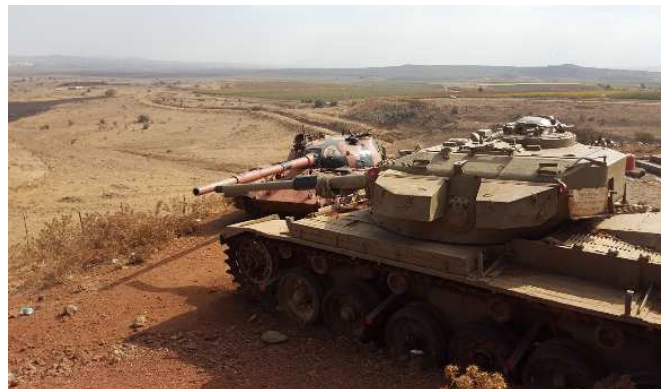
(Foto po lewej: Na granicy syryjskiej, tzw. „Dolina łez”, za czołgami Syria. Po prawej: Liban)