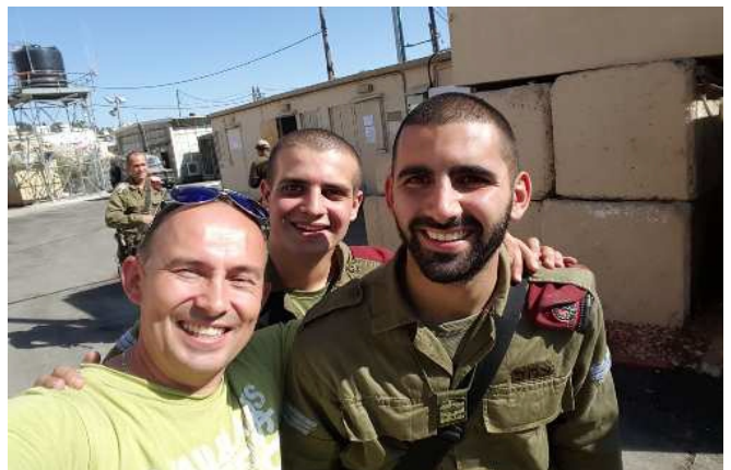
(Z żołnierzami pilnującymi bezpieczeństwa w centrum Hebronu)