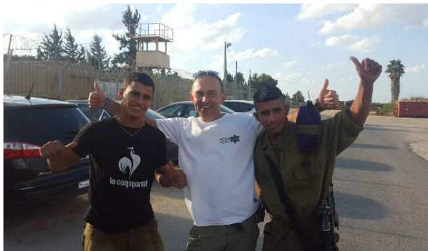
(Foto z lewej: Z beduińskimi, arabskimi żołnierzami IDF na granicy z Gazą, z prawej: Hebron)

Załączam krótką fotorelację z wyjazdu i pozdrawiam serdecznie.