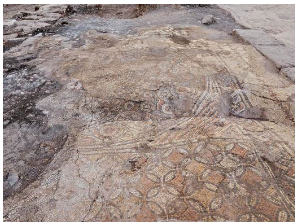
(Foto: Przypadkowo odkryte 30 grudnia zabudowania z pięknymi mozaikami datowane na ponad 1500 lat w Rosh ha Ajin)

Był to także rok, w którym obserwowaliśmy w Izraelu tzw. „czerwone księżycy”. Jest to bardzo rzadkie zjawisko opisane w Biblii jako znak, który ma wystąpić w czasach ostatecznych (Dzieje Apostolskie 2,19-20). W trakcie tego zjawiska rozpoczęła się obecna fala 143 już zarejestrowanych zamachów nożowniczych, samochodowych i strzelanin, w trakcie których zginęło 24 Izraelczyków, a wielu zostało ciężko okaleczonych.