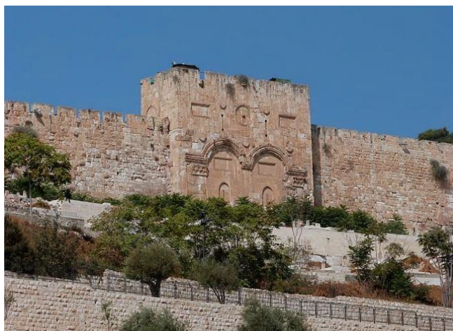
(foto: „Złota Brama”, hebr.: שער הרחמים , Sza'ar ha-Rachamim – „Brama Miłosierdzia”)

Drugą istotną, zawartą w tym oświadczeniu informacją jest to, iż dążeniem Palestyńczyków nie jest posiadanie stolicy w miejscu obecnej – w Ramallah, lecz w Jerozolimie. Wg nich wiąże się to automatycznie z zakazem wstępu Żydów do ich stolicy, a szczególnie do tzw. Wschodniej Jerozolimy, czyli dokładnie do miejsca, gdzie znajduje się Góra Oliwna i „Złota Brama” – miejsca związane z ponownym przyjściem Mesjasza Jezui. Jest to tak naprawdę walka duchowa, w której tak ważne są nasze modlitwy.