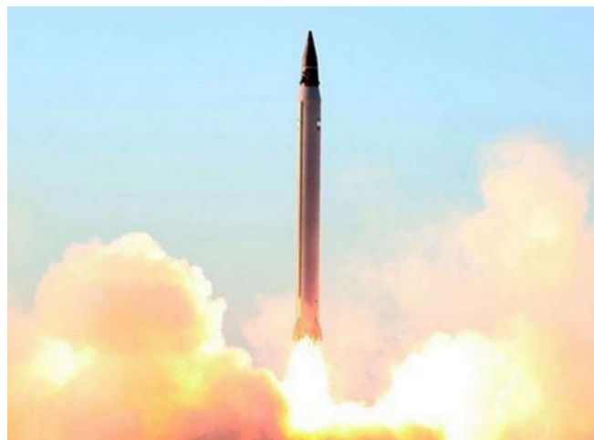
(foto: Odpalenie irańskiej rakiety mogącej przenosić ładunki nuklearne).

(O takich, pewnych zamiarach Iranu, Izrael informował wszystkich przed zniesieniem poprzednich sankcji). W odpowiedzi na amerykańskie sankcje Iran rozpoczął rozszerzanie swojego planu raketowego.