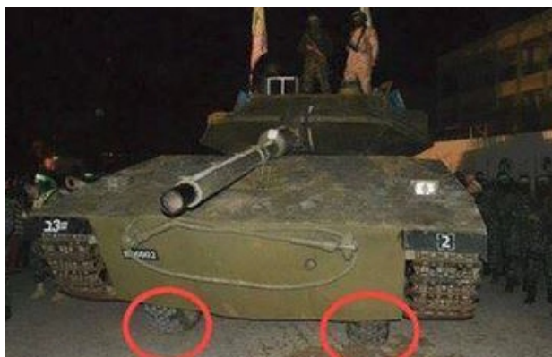
(Foto: „zdobywczy” czołg izraelski typu „Merkava”, a poniżej dla porównania „nie zdobyty” oryginał)

2. W Strefie Gazy ogłoszono wielki sukces bojowników! Pokazano zdobytą izraelski czołg „Merkava”. Problem w tym, że już na zdjęciach widać, iż jest to coś zbudowane na platformie samochodu. Ale sukces to sukces.