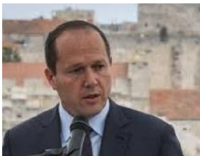
Foto: Nir Barkat, burmistrz Jerozolimy

Nir Barkat, burmistrz Jerozolimy, powiedział: „Rozmawiałem z dzielnymi wojownikami, którzy nie ociągali się nawet na chwilę. To była prawdziwa bitwa. W tej walce jerozolimscy policjanci i Magav udarmenili jeszcze większą tragedię. Społeczeństwo Jerozolimy musi otworzyć oczy i nie zwlekać z reakcją w takich przypadkach. Czujność zapobiega atakom”.