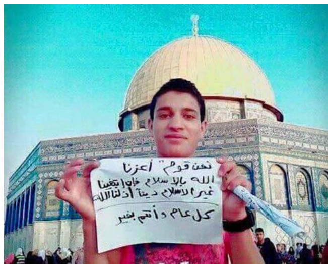
(Foto: Palestyńczyk ogłaszający chęć dokonania zamachu terrorystycznego)

Jego dane zostają przekazane odpowiednim służbom w celu aresztowania i przesłuchania go. Parę miesięcy temu dwóch mieszkańców wschodniej części Jerozolimy zostało aresztowanych, oskarżonych o podżeganie i skazanych na kary od 9 do 17 miesięcy więzienia.