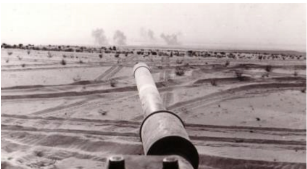
(Foto: historyczne zdjęcia z walk z armią syryjską w wojnie Jom Kippur)

2. Ok. 01.55 w nocy jedna osoba została lekko ranna w wyniku ataku nożem we wschodniej Jerozolimie. Zgłosiła na policję, że została raniona przez Araba. Policja sprawdza zajście.