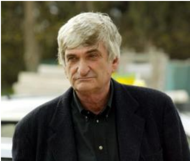
(Foto: obecna fotografia generała Janusza Ludwiga (Awigdora ben Gal) –