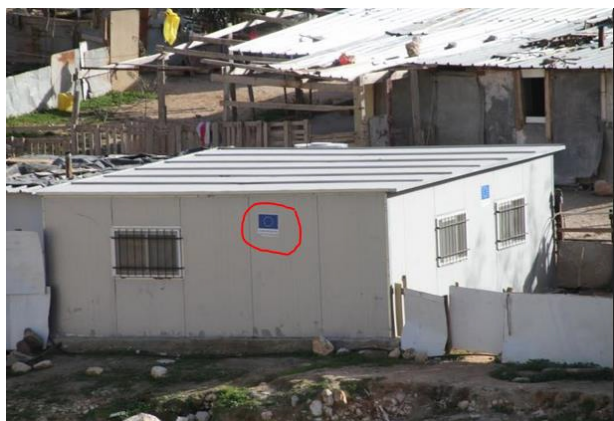
(Foto: Obrazek ilustrujący zaangażowanie UE w burzenie izraelskich domów i nielegalne budowanie arabskich)