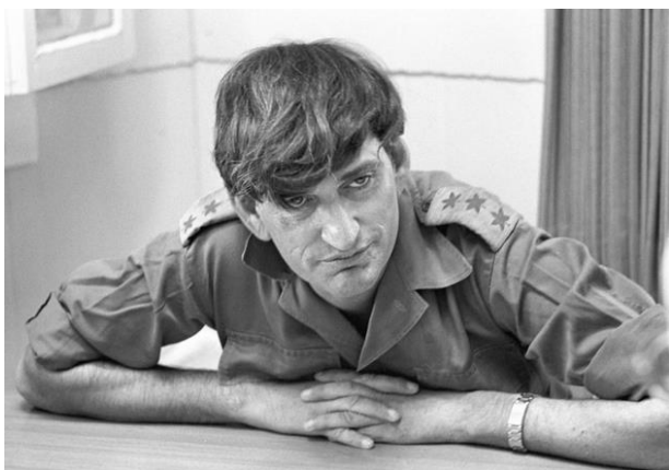
(Foto: Janusz Ludwig (Awigdor ben Gal) – polski Żyd z Łodzi, który powstrzymał armię syryjską w wojnie Jom Kippur)

1. Generał rezerwy AWIGDOR („JANUSZ”) BEN-GAL, jeden z najbardziej znanych, cenionych i legendarnych dowódców IDF, zmarł w wieku 80 lat. Urodził się w Łodzi w 1936 r. Wojnę przeżył w ZSRR (Syberia). Do mandatowej Palestyny dotarł w 1943 z „Dziećmi Teheranu”. Do wojska wstąpił w 1955r. Był dowódcą oddziału czołgów. Podczas wojny 6-dniowej został ranny w nogę i kulał od tego czasu. W 1973 dowodził siłami pancernymi (7 brygada – na mapce), które zdołały powstrzymać napór Syryjczyków na północnym Golanie w pierwszych dniach wojny Jom Kippur, dysponując kilkukrotnie mniejszymi siłami. Był również między innymi dowódcą okręgu północnego Izraela.