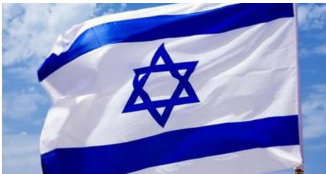
Zakaz bojkotu izraelskich produktów przez sektor publiczny w Anglii

Ostrzeżono także, że decyzje o bojkocie mogą „zaszkodzić brytyjskiemu eksportowi i międzynarodowym relacjom” (wg Onet). Świadczy to o przełomie w bojkocie Unii Europejskiej. Chwała Bogu! I dziękujemy za modlitwy.