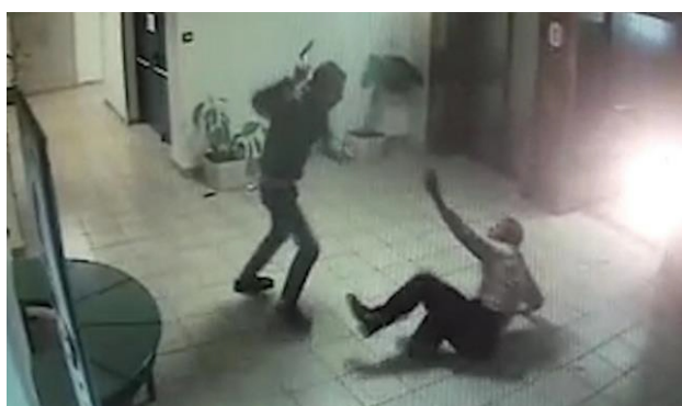
(Foto po prawej: Zarejestrowana przez kamery scena ataku Palestyńczyka na ochroniarza)

Ze śledztwa wynika, że ochroniarz znał terrorystę, który był zatrudniony w sklepie i zajmował się układaniem towaru w nocy po zamknięciu sklepu.