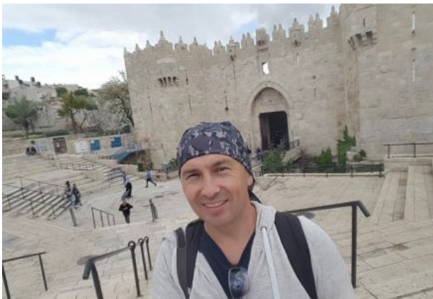
(Foto z 13.04.2016 wykonane przy Bramie Damasceńskiej)

Wznawiam wysyłanie wiadomości po przerwie związanej z dwoma ważnymi wyjazdami do Izraela. Jak widzimy, w Izraelu zawsze wiele się dzieje, ale dużo zależy również od naszych modlitw.