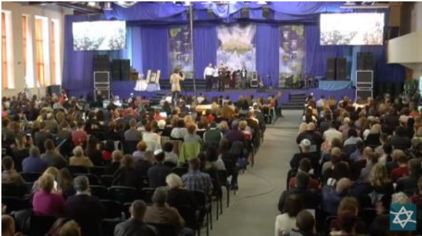
(Foto: Zdjęcia z transmitowanego na żywo nabożeństwa z Kijowa i gorącej relacji/świadectw z tego, co się działo podczas pobytu i modlitw w Polsce)

11. Pamiętajmy o zbliżającym się już za kilka dni święcie Paschy (hebr. Pesach). Właśnie podczas takich świąt terroryści lubią nasilać swoje działania. Wysoki oficer IDF powiedział, że pomimo osłabnięcia fali terroru, armia obawia się, że może to być cisza przed burzą. „Ta tendencja może się szybko zmienić, a my przygotowujemy się do drastycznego pogorszenia się sytuacji bezpieczeństwa podczas świąt Pesach, gdy istnieje wysokie zagrożenie, oraz w Dniu Niepodległości i miesiącu Ramadan. Na okres świąt Pesach siły w Samarii i Judei zostaną wzmocnione dodatkowymi dwoma batalionami piechoty”.