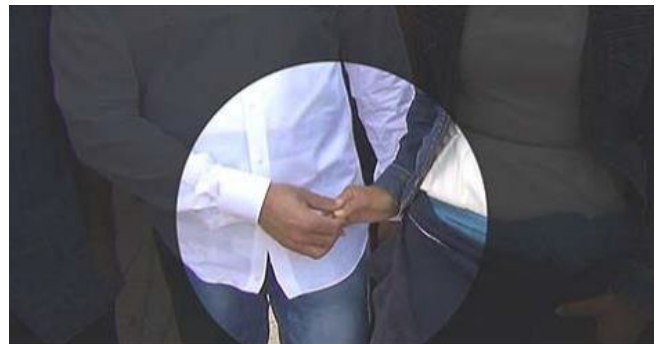
(Zdjęcie uroczystości zaślubin, niby spaceru)