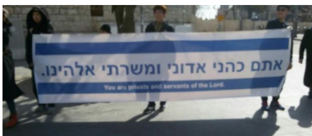
(Foto: Baner z napisem „Jesteście kapłanami i sługami Pana (Boga)”)

Rozdawali też ulotki w formie listu: „Przepraszamy. Żydzi, wierzymy w waszego Boga, tak jak Rut w Tanachu (Biblii). Piszemy ten list, żeby was przeprosić. Naprawdę żałujemy tego, co chrześcijaństwo i chrześcijanie zrobili Żydom od IV wieku. W XI wieku krzyżowcy splądrowali żydowskie tereny i zamordowali wielu Żydów. W XV i XVI w. wielu Żydów spłonęło w ogniu inkwizycji. W XVI w. chrześcijański reformator wydał surowe rozkazy w stosunku do Żydów (*Mowa o M. Lutrze), a w XX w. 6 milionów Żydów zginęło przy zgodzie i milczeniu Kościoła.