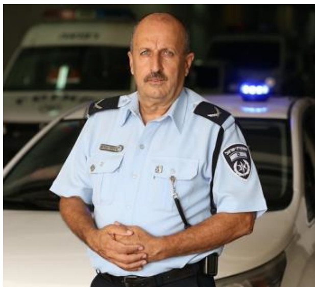
(Foto: Arabsko-palestyński generał policji izraelskiej, Jamal Chachrush)

5. Minister bezpieczeństwa wewnętrznego planuje stworzenie wydziału do egzekwowania prawa w sektorze arabskim, zachęcając do rekrutacji palestyńskich Arabów (muzułman) w szeregi policji. Oczekuje się, że na czele tego wydziału stanie Jamal Chachrush w randze generała w policji izraelskiej.