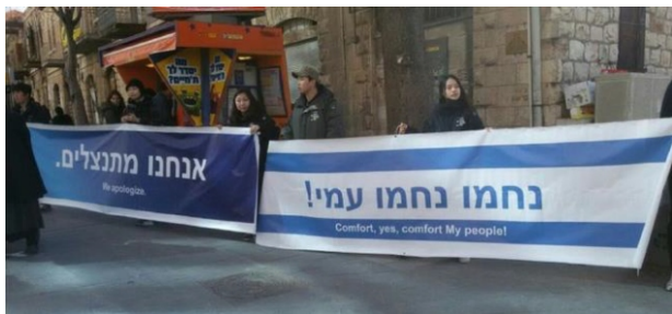
(Foto: Banery z napisami: „Przepraszamy”, „Pocieszajcie, Tak, Pocieszajcie Mój lud!”)

1. Wczoraj w Jerozolimie 20 chrześcijan Chińczyków demonstrowało w poparciu dla Izraela. Mieli ze sobą banery w języku hebrajskim i angielskim: