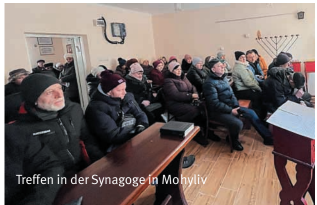
Treffen in der Synagoge in Mohyliv

Der nächste Ort, den wir während unseres Aufenthalts in der Ukraine besuchten, war Mohyliv-Podilskyj. Seit vielen Jahren unterstützen wir dort die jüdische Gemeinschaft durch tägliche Mittagessen in der Kantine, die sich in der örtlichen Synagoge befindet. Dieses Mal jedoch kamen wir, um Lebensmittelgutscheine an alle Bedürftigen dieser Stadt zu