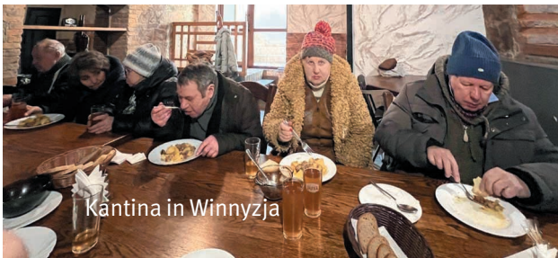
Kantina in Winnyzja

Während unseres Aufenthalts in Winnyzja besuchten wir auch eine der Kantinen, die wir unterstützen. [26] Mit großer Freude trafen wir unsere Lieben, und während des gemeinsamen Mittagessens teilten wir – wie immer – die Freude darüber, wer der Messias Israels, Jeschua, für uns ist. Ebenso hörten wir aufmerksam allem zu, was sie mit uns teilen wollten.