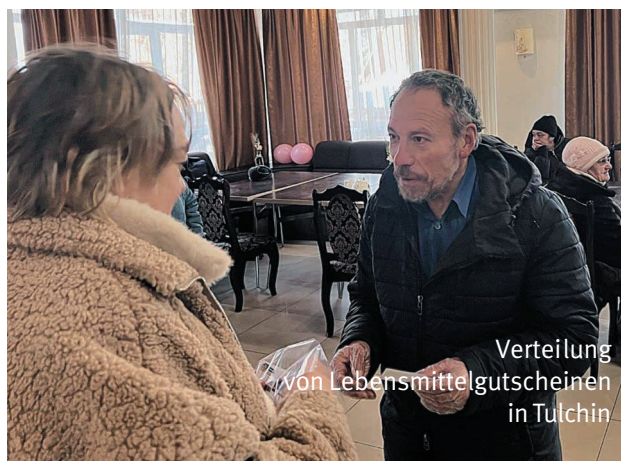
Verteilung von Lebensmittelgutscheinen in Tulchin

Während unseres Aufenthalts in der Ukraine fuhren wir auch nach Tultschyn. Dank der Gnade Gottes sowie Eurer Fürsorge und Unterstützung funktioniert dort eine Kantine für die bedürftigsten Mitglieder der jüdischen Gemeinschaft dieser Stadt. Dieses Mal kamen wir nach Tultschyn auch, um Lebensmittelgutscheine an alle Bedürftigen zu verteilen.